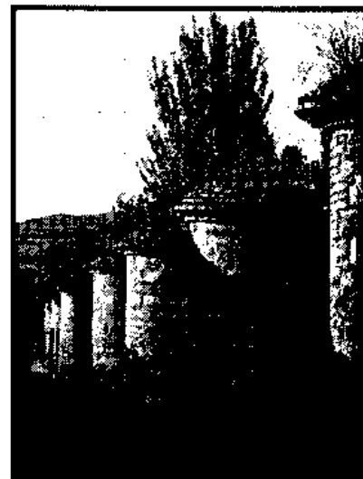
Arriba, vista del monasterio desde el exterior; en estas líneas, la muralla, sólo separada

La iglesia resulta impresionante por su monumentalidad y dimensiones. Corresponde al barroco clasicista o de la Academia y fue proyectada, según Madoz, por